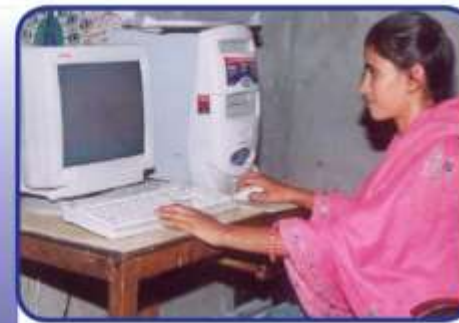
FULLY ONLINE DISTANCE LEARNING