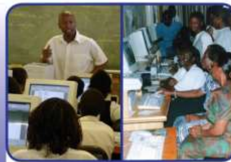
BLENDED LEARNING (FACE-TO-FACE + ONLINE)