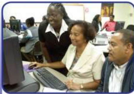
ICT IN SUPPORT OF FACE-TO-FACE TEACHING